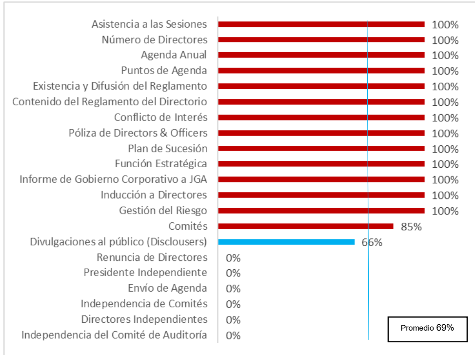
Gráfico N° 2: Evaluación del directorio 1 – Resultados por elemento

El elemento “Independencia de comités” se encuentra relacionado con la siguiente pregunta: “(Todos / Algunos / Ningún) _____ comité(s) está(n) conformado(s) por mayoría de miembros independientes” .